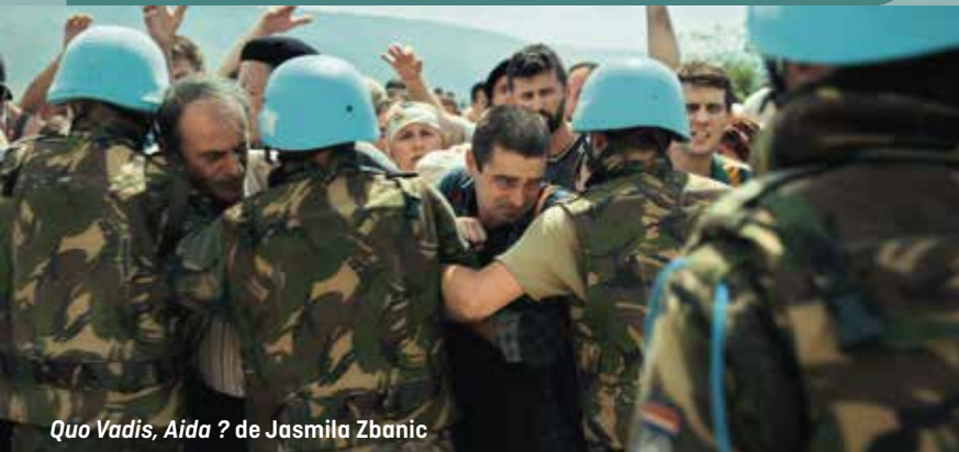
Quo Vadis, Aida ? de Jasmila Zbanic

➔ Toutes aussi importantes, les thématiques liées à l' environnement , au genre , au harcèlement , à l' éducation aux médias , aux inégalités socio-économiques ou encore à l' engagement citoyen ne sont pas en reste et bénéficient également d'animations de qualité avec des partenaires associatifs ou des personnes ressources qui ont pour habitude d'intervenir en milieu scolaire.